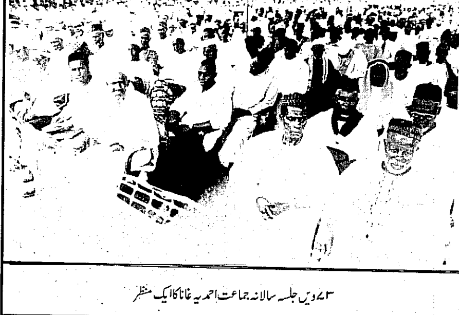
۳۷ ویں جلسہ سالانہ جماعت احمدیہ غانا کا ایک منظر

ایک مبلغ کو ایک چرچ میں اسلام پر لیکچر دینے کے لئے بلایا گیا۔ اس طرح چرچ والوں سے تعلقات پیدا ہوئے۔ چرچ مسجد کے قریب تھا۔ مسجد میں توسیع کے باعث ایک موقع ایسا آیا کہ اس میں نماز جمعہ ادا کرنا مشکل ہو گئی۔ چرچ والوں کو اس مشکل کا علم ہوا تو انہوں نے چرچ میں نماز جمعہ ادا کرنے کی پیشکش کی۔ چنانچہ ان حالات میں چرچ کے ایک حصہ میں نماز جمعہ ادا کی گئی۔