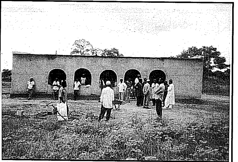
مسجد احمدیہ Kapili ضلع Petauke زیمبیا۔ اس جگہ خدا تعالیٰ کے فضل سے نئی جماعت قائم ہوئی ہے اور یہ یہاں کی پہلی احمدیہ مسجد ہے