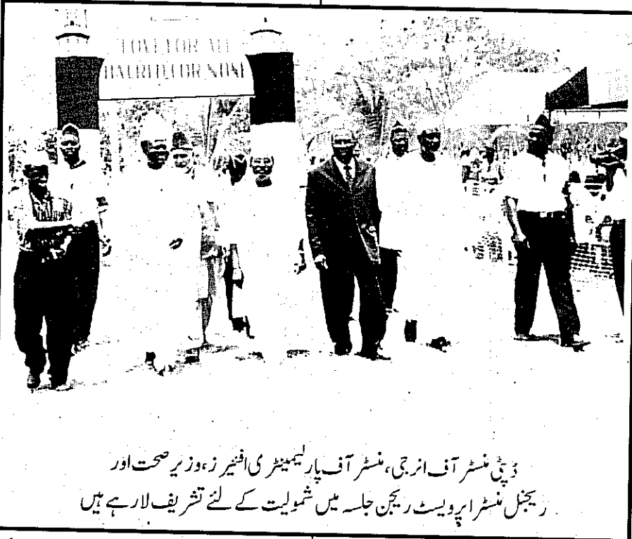
ڈپٹی منسٹر آف انرجی، منسٹر آف پارلیمنٹری افیئرز، وزیر صحت اور ریجنل منسٹر اپرویسٹ ریجن جلسہ میں شمولیت کے لئے تشریف لارہے ہیں

آپ نے حضرت مسیح موعود علیہ السلام کی ایک تحریر پڑھ کر سنائی جس میں خدا تعالیٰ کی طرف