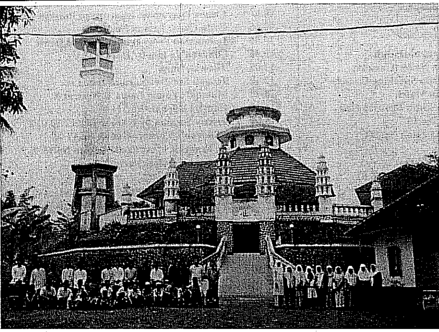
یہی مسجد ۱۹۸۸ء میں دوبارہ تعمیر کی گئی ہے۔ مسجد کے سامنے مجلس عاملہ جماعت احمدیہ سنگاپارنا اور احباب جماعت کے ساتھ ایک گروپ فوٹو

خدا کی تقدیر یہ فیصلہ کر چکی ہے کہ ہر سال احمدیت کے حق میں ایک نئی شان لے کر آئے گا۔ ہر سال احمدیت کا سال ہو گا۔