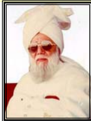
Hadrat Mirza Nasir Ahmad rh Khalifatoul Messie III

J'affirme, à partir de ma propre expérience, que le Saint Coran contient toutes les connaissances. Je n'ai guère eu de connaissances sécu-