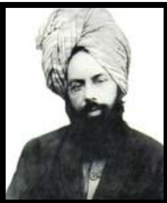
Mirza Ghulam Ahmad Le Messie et le Mahdi Promis as

Dis : « Tout ceci est par la grâce d'Allah et par Sa mi-