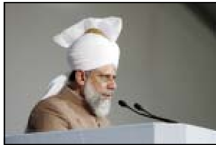
Hadrat Khalifatoul Messie V atba en livrant son discours

Cette année 271000 personnes ont bénéficié des 267 expositions à travers le monde.