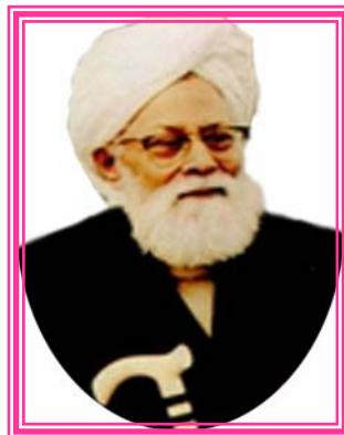
Hadhrat Mirza Bashiroudine Mahmud Ahmad r.a , Khalifatoul MasihII

plètement libre de tout défaut et faiblesse inimaginables.