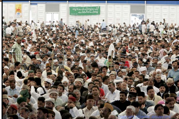
Plus de 29 000 personnes des pays différents participèrent la Jalsa Salana 2006 de Londres.