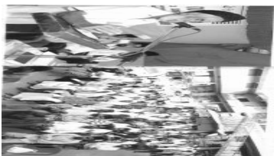
മഞ്ചേരിയിൽ 22.8.08-ന് നടന്ന വിലാപത്ത് ജൂബിലി സമ്മേളനം; ഉദ്ഘാടന ചടങ്ങിന്റെ ദൃശ്യം (വിദഗ്ദ്ധരായ റിപ്പോർട്ടർമാരുടെയും അൽഹബിന്റെയും)