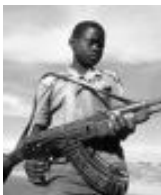
കുട്ടിപ്പട്ടാളം വിട്ടിലേക്ക് മടങ്ങുന്നു