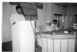
അൻസാനുല്ലാ സമ്മേളനം എറണാകുളം മേഖല