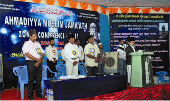
அஹ்மதிய்யா முஸ்லிம் ஜமாஅத் இந்திய முதன்மைச் செயலர் அவர்கள் உறுதிமொழி கூறும் காட்சி