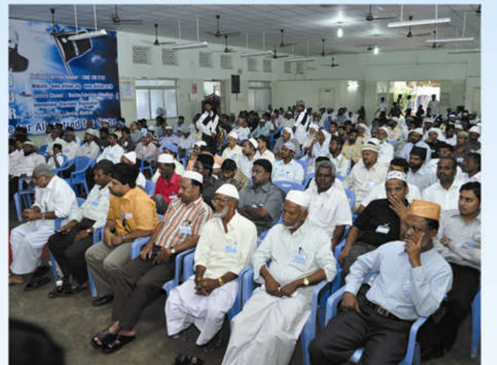
மாநாட்டிற்கு வருகை தந்தவர்களின் ஒரு பகுதி