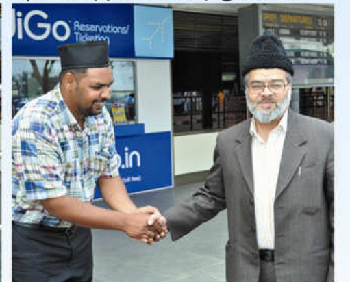
கோயம்புத்தூர் அஹ்மதிய்யா முஸ்லிம் ஜமாஅத்தின் பொறுப்பாளர்கள் இந்திய முதன்மைச் செயலர் அவர்களை விமான நிலையத்தில் வரவேற்கும் காட்சி