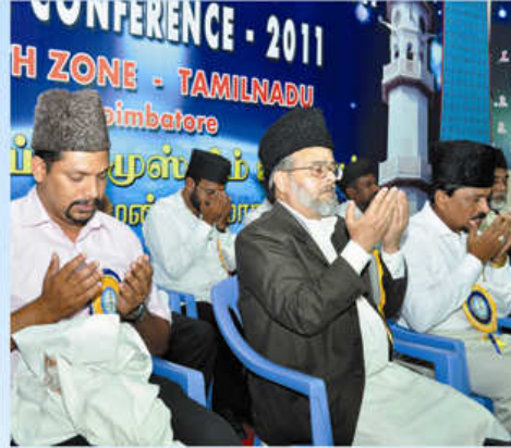
மாநாட்டு நிறைவில் துஆ செய்யும் காட்சி