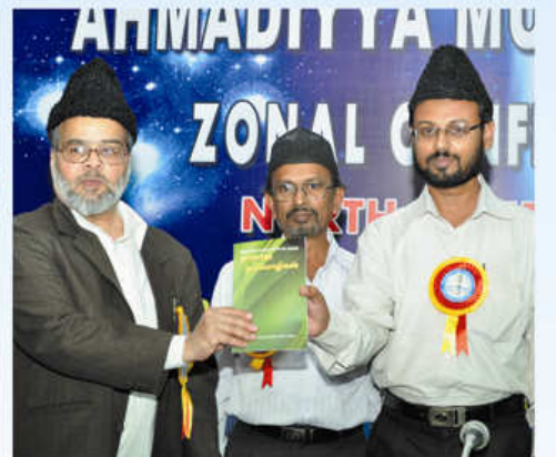
மாநாட்டின் போது மூன்று புத்தகங்கள் வெளியிடப்பட்டு அதனை மொழியாக்கம் செய்தவர்கள் முதல் பிரதியை பெறும் காட்சி