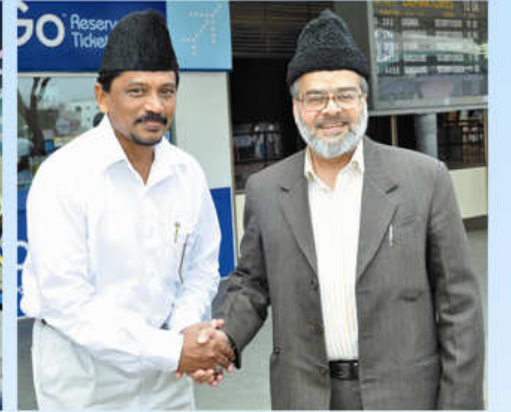
தமிழக வடமண்டல அமீர், இந்திய முதன்மைச் செயலரை விமான நிலையத்தில் வரவேற்கும் காட்சி