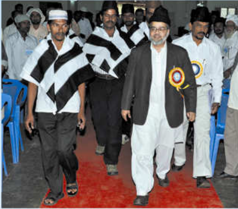
சிறப்பு விருந்தினர் அவர்கள் மாநாட்டு அரங்கிற்கு வரும் காட்சி