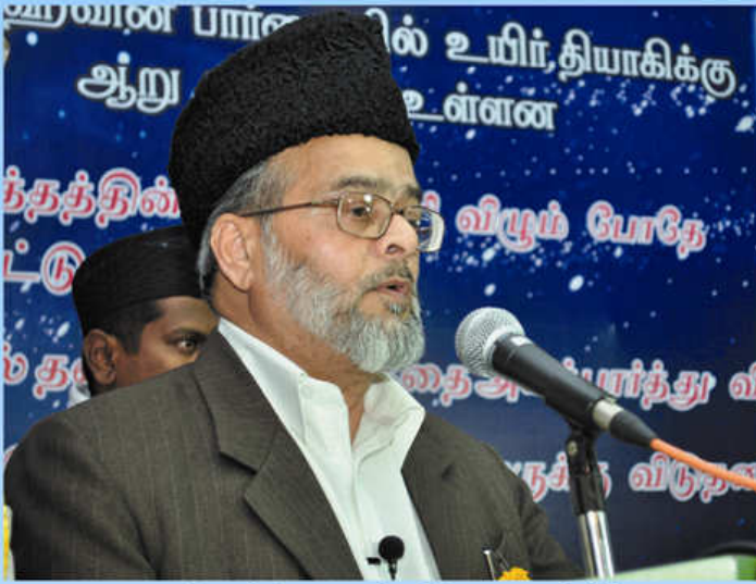
அஹ்மதிய்யா முஸ்லிம் ஜமாஅத்தின் இந்திய முதன்மைச் செயலர் சிறப்புரையாற்றும் காட்சி