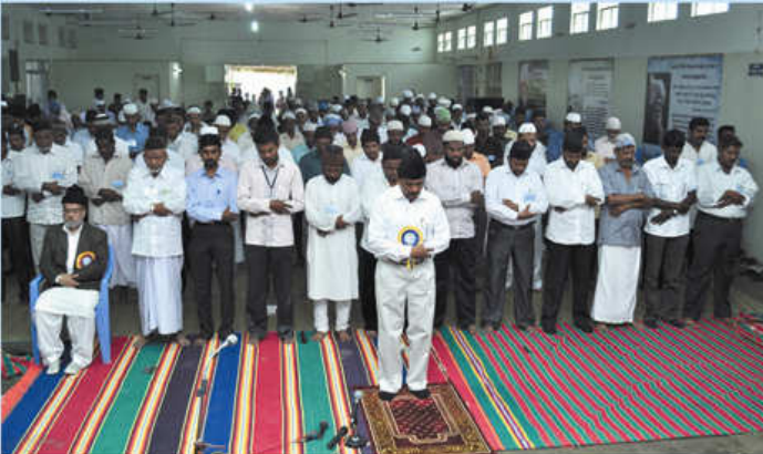
மாநாட்டின் போது தொழுகை நடைபெறும் காட்சி