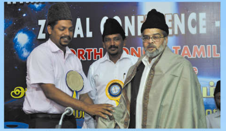
கோயமுத்தூர் அஹ்மதிய்யா முஸ்லிம் ஜமாஅத் தலைவர் இந்திய முதன்மைச் செயலர் அவர்களுக்கு சால்வை போர்த்தி கவுரவிக்கும் காட்சி