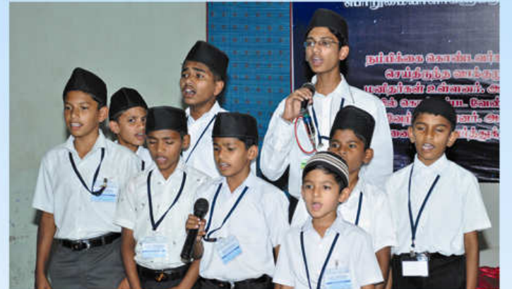
கோயம்புத்தூர் அத்ஃபால் சிறுவர்கள் உருது கவிதை பாடும் காட்சி