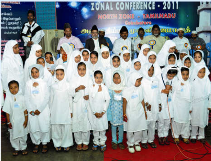
கோயம்புத்தூர் நாளிராத் சிறுமிகள் உருது கவிதை பாடும் காட்சி