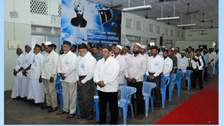
மாநாட்டில் கலந்து கொண்டவர்கள் உறுதிமொழி கூறும் காட்சி