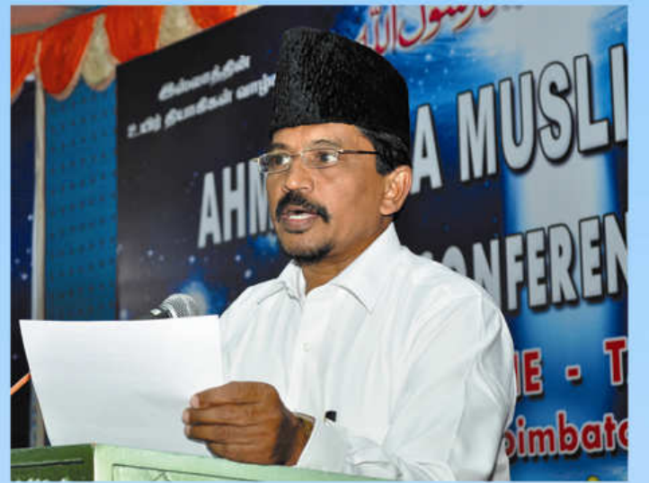
அஹ்மதிய்யா முஸ்லிம் ஜமாஅத்தின் தமிழக வடமண்டல அமீர் தலைமை உரையாற்றும் காட்சி