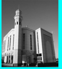
ബൈത്തുൽ ഹുസ്ന, ലണ്ടൻ