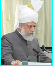
ഖലീഫത്തുൽ മസീഹ് അൽ ഖാദിം