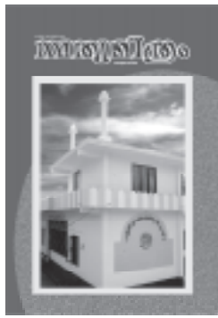
മുഖചിത്രം: കാസർഗോഡ് ജില്ലയിലെ മോശ്രാലിൽ പുതുക്കിപ്പണിത അഹ്മദിയ്യാ മുസ്ലിം മസ്ജിദ്