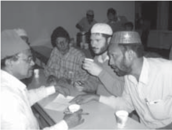
മർക്കര മസ്ജിദിൽ മേഖലാ നാസിം മർക്കര പ്രസിഡന്റുമായി കൂടി യാലോചന നടത്തുന്നു

തീരുമാനമെടുത്തു. ഹോട്ടലിന് തൊട്ടുപിറകിൽ തന്നെയാണ് മസ്ജിദ്. ‘മസ്ജിദ് ഖദീജത്തുൽ ഖുബ്റ’ അതാണ് പേര്. മൗലവി സാഹിബിന്റെ നേതൃത്വത്തിൽ നമസ്കരിച്ചതിനുശേഷം യാത്ര തുടർന്നു.